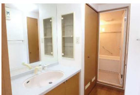
シャワー付洗面化粧台！収納有り！

ローン返済例 2,100万円借入時 35年返済 福岡銀行 紹介ローン ※※一括払い無し 金利0.85% 35年返済の場合 月々 57,823円