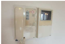
★モニター付インターホン