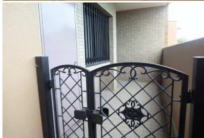
★角部屋の特権！玄関ポーチが7.27㎡あります！