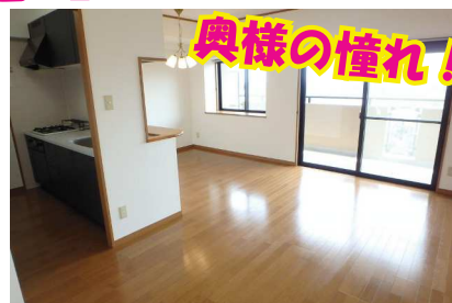
カウンタータイプのキッチンです！