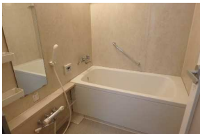
浴室も広く開放的です！自動お湯張り